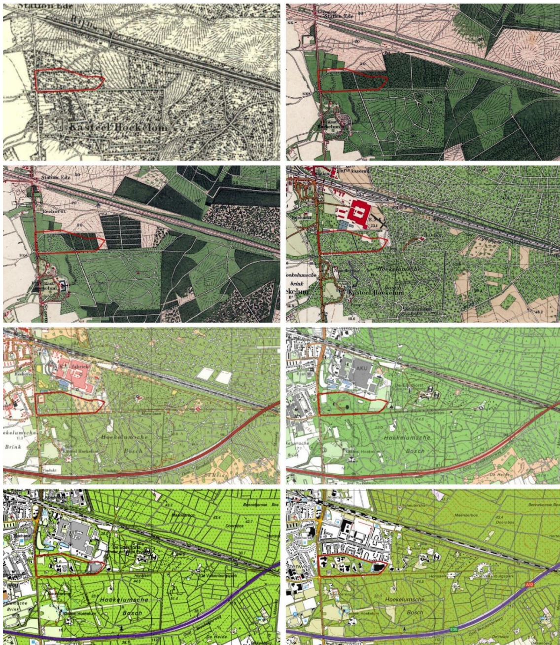
Figuur 3: Ontwikkeling Horapark 1850-1872-1893-1930-1973-1990-2000-2020

natuurbehoud aan kunnen tasten. Juist in deze gebieden wil de Provincie herstel en versterking van de natuur.