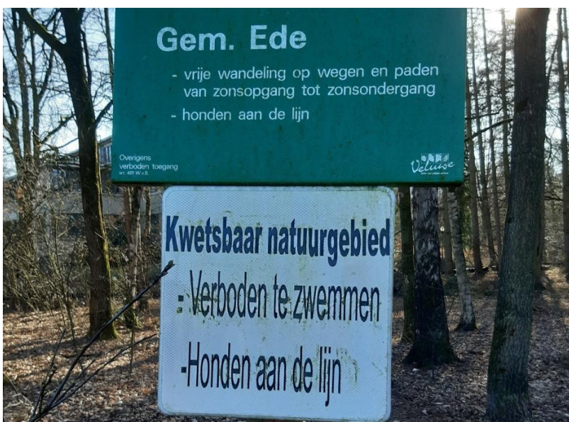
Afbeelding 1: bord bij toegang tot Horapark

Naast negatieve effecten op het Horapark betekent dit plan een aanslag op de rust en de natuurwaarden in het zuidelijk gelegen Hoekelumse bos -beter bekend als Landgoed Hoekelum- dat onderdeel is van het Natura 2000-gebied Veluwe. Dit bos is reeds een populair natuurgebied waarin, ondanks de huidige hoge recreatiedruk, veel diersoorten voorkomen waaronder vele vogelsoorten, vleermuizen, boommarters, amfibieën, reeën, vossen en wilde zwijnen. Daarnaast liggen bij de Horalaan verscheidene percelen die gekarteerd zijn en zich kenmerken als het habitatype beuken-eikenbossen met hulst (H9120). Dit habitatype is gevoelig voor stikstofdepositie en in de huidige situatie is al sprake van een overschrijding van de kritische depositiewaarde. Het voornemen van het plan om middels interne saldering de ontwikkeling doorgang te laten geven, ziet daarbij de extra verkeersbewegingen in de gebruiksfase en de daarbij behorende depositie op dit reeds overbelast habitatype volledig over het hoofd. De hiermee gepaard gaande drukte leidt daarbij tot een extra belasting op een reeds overbelast systeem waarbij ook effecten optreden in verder weg gelegen delen van dit N2000-gebied.