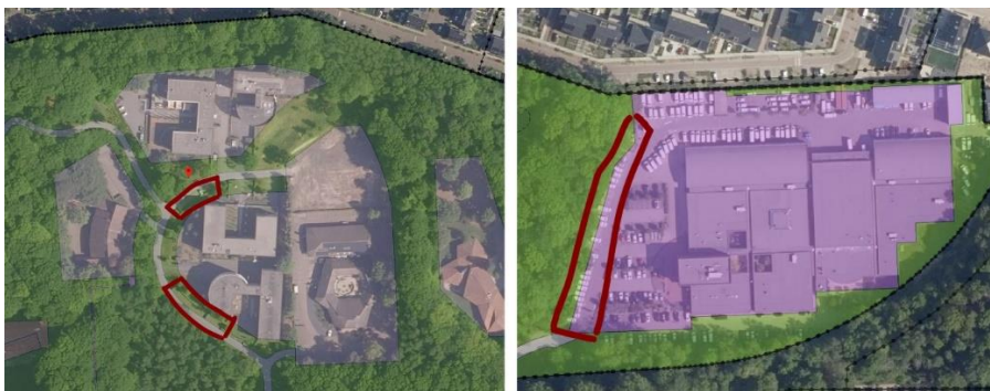
Figuur 1: parkeren in bestemmingszones Bos

Wij constateren dat in het Horapark zoals deze nu is vormgegeven ter plaatse van de vlekken B en D momenteel parkeerplaatsen gerealiseerd zijn die strijdig zijn met het vigerende bestemmingsplan. De in het onderstaande figuur aangeduide parkeerstroken zijn opgenomen in de gebieden met bestemming Bos. Binnen de bestemming bos is geen ruimte opgenomen voor de functie parkeren. Wij verzoeken u de aanwezige verharding te laten verwijderen en het landschap weer de ruimte te geven.